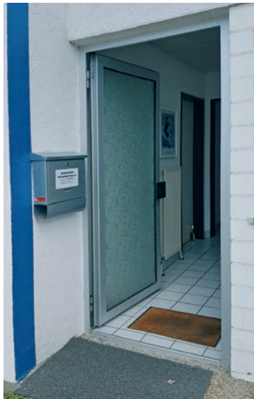
Von der Straße aus erreichen die Besucher unsere Geschäftsstelle ...