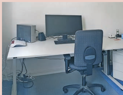
... ist mit viel Platz und guter Technik ausgestattet ...