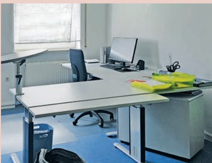
Die helle Arbeitsecke in der neuen Geschäftsstelle in Bammental ...